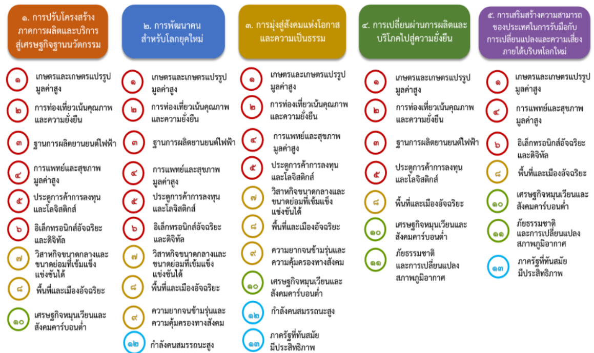
แผนภาพที่ ๓.๑ ความเชื่อมโยงระหว่างหมวดหมายการพัฒนา กับเป้าหมายหลัก

ความเชื่อมโยงระหว่างหมวดหมายการพัฒนา กับเป้าหมายหลักแสดงไว้ในแผนภาพที่ ๓.๑ โดยหมวดหมายการพัฒนาที่กำหนดขึ้นเป็นประเด็นที่มีลักษณะเชิงบูรณาการที่ครอบคลุมการพัฒนาตั้งแต่ในระดับต้นน้ำจนถึงปลายน้ำ และสามารถนำไปสู่ผลพัฒนาทั้งในมิติเศรษฐกิจ สังคม ทรัพยากรธรรมชาติและสิ่งแวดล้อมไปพร้อมๆ กัน ทำให้หมวดหมายแต่ละประการสามารถสนับสนุนเป้าหมายหลักได้มากกว่าหนึ่งข้อ นอกจากนี้การพัฒนาภายใต้แต่ละหมวดหมายไม่ได้แยกขาดจากกัน แต่มีการสนับสนุนหรือเอื้อประโยชน์ซึ่งกันและกัน